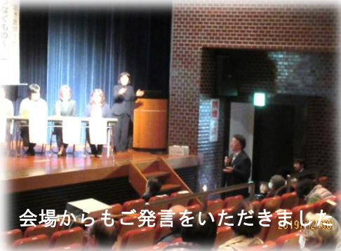
会場からもご発言をいただきました