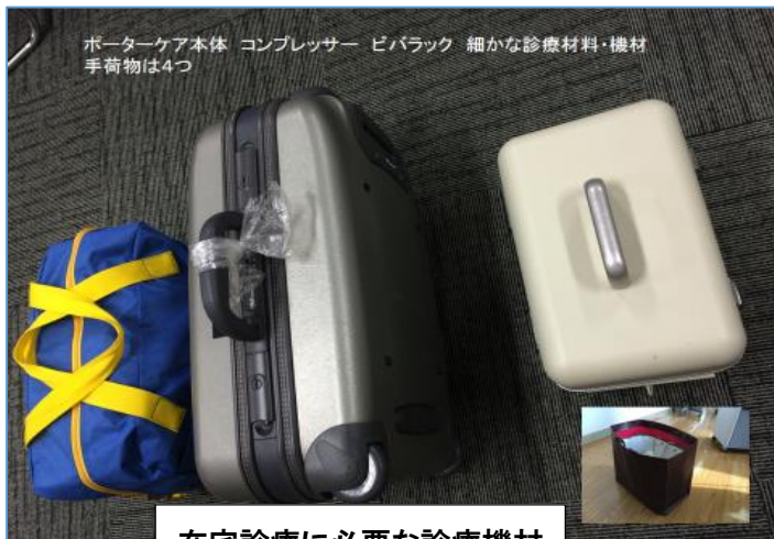
在宅診療に必要な診療機材