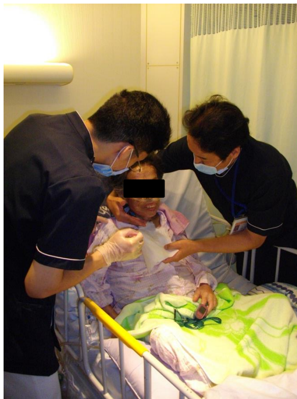
理学療法士と言語聴覚士による嚥下訓練